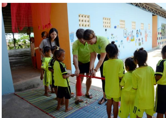
Abbildung 10: Eröffnungsfeier III