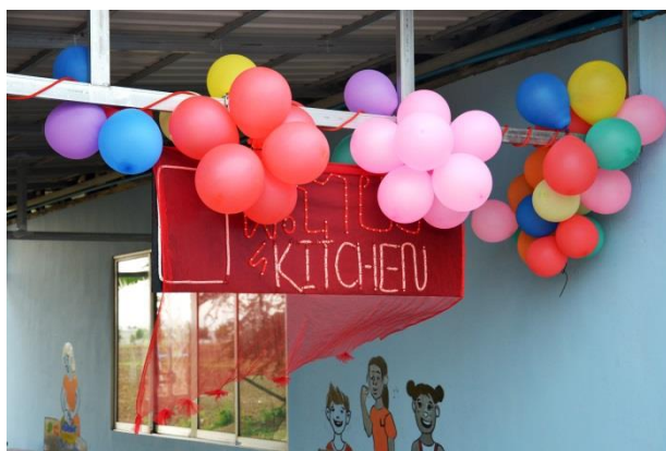
Abbildung 8: Eröffnungsfeier I