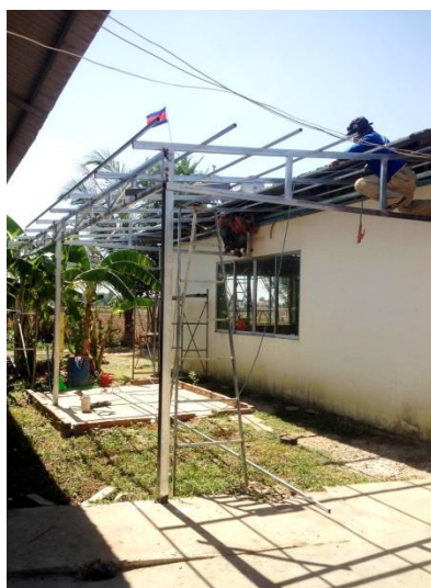
Abbildung 3: Baufortschritt I