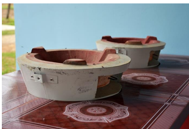
Abbildung 6: Neue Kochstelle im SAB