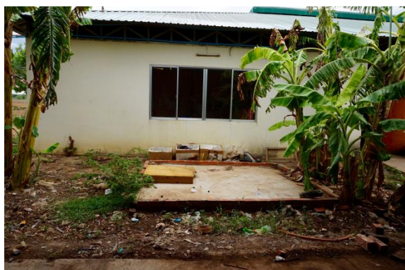
Abbildung 1: Baubereich des SABs vor der Errichtung der Küche