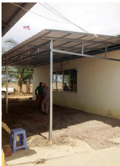
Abbildung 4: Baufortschritt II