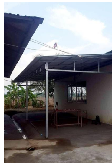
Abbildung 5: Baufortschritt III