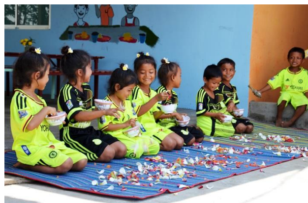
Abbildung 9: Eröffnungsfeier II